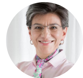
Claudia López Alcaldesa de Bogotá, Colombia Modera