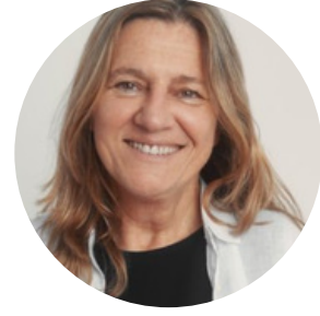
Silvana Pisano Alcaldesa Municipio B Montevideo, Uruguay