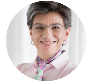
Claudia López Alcaldesa de Bogotá, Colombia Modera