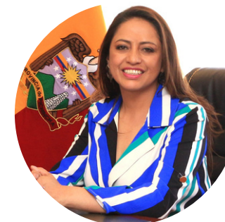
Paola Pabón Alcaldesa de Pichincha, Quito. Vicepresidenta de CGLU por el foro de las Regiones.