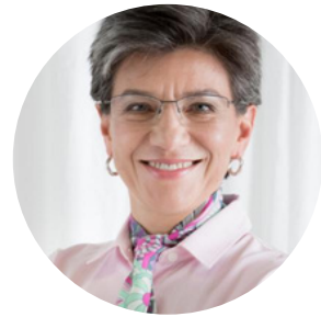
Claudia López Bogotá, Colombia