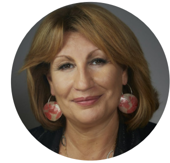
Emilia Saiz Secretaria General de Ciudades y Gobiernos Locales Unidos (CGLU), España Modera