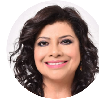
Clara Brugada Molina Alcaldesa Iztapalapa, México