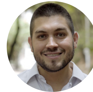
Óscar Escobar Alcalde de Palmira, Colombia