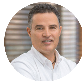
Aníbal Gaviria Gobernador de Antioquia, Colombia En confirmación