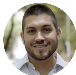
Óscar Escobar Palmira, Colombia