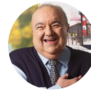
Rafael Greca Curitiba, Brasil