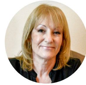
Carolina Cosse Montevideo, Uruguay