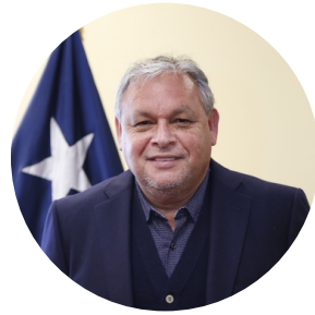
Rodrigo Mundaca Gobernador de Valparaiso, Chile