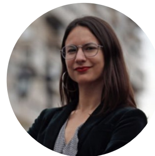
Irací Hassler Alcaldesa de Santiago, Chile