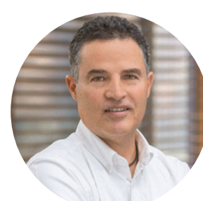
Aníbal Gaviria Antioquia, Colombia TBC