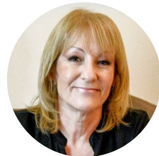
Carolina Cosse Alcaldesa de Montevideo, Uruguay y presidenta del CGLU

¿CÓMO DESDE UNA VISIÓN DEL CUIDADO SE AVANZA EN LAS AGENDAS DE IGUALDAD, EQUIDAD Y SOSTENIBILIDAD?