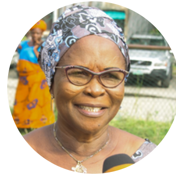
Omolola Essien Alcaldesa del Gobierno Local de Lagos Continental. Presidenta Red de Mujeres Locales Electas en África (REFELA)