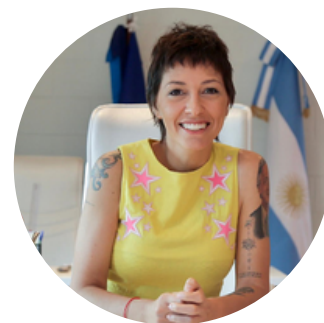
Mayra Mendoza Alcaldesa de Quilmes, Argentina