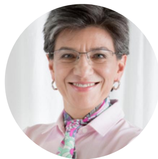
Claudia López Alcaldesa de Bogotá, Colombia