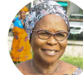
Omolola Essien Alcaldesa del Gobierno Local de Lagos Continental