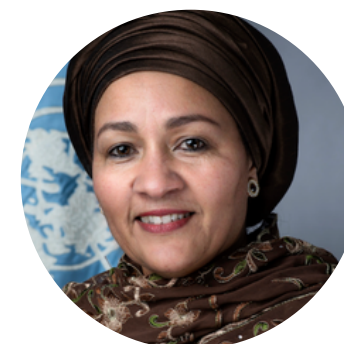
Amina J. Mohammed Vicesecretaría General de Naciones Unidas Virtual