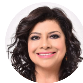
Clara Brugada Iztapalapa, México