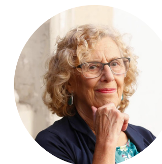
Manuela Carmena Cofundadora del Foro Mundial de Ciudades y Territorios de Paz. Ex alcaldesa de Madrid 2015 - 2019 Virtual