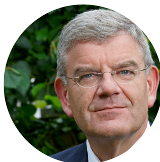
Jan van Zanen Alcalde de La Haya, Países Bajos