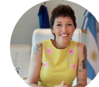
Mayra Mendoza Alcaldesa de Quilmes, Argentina